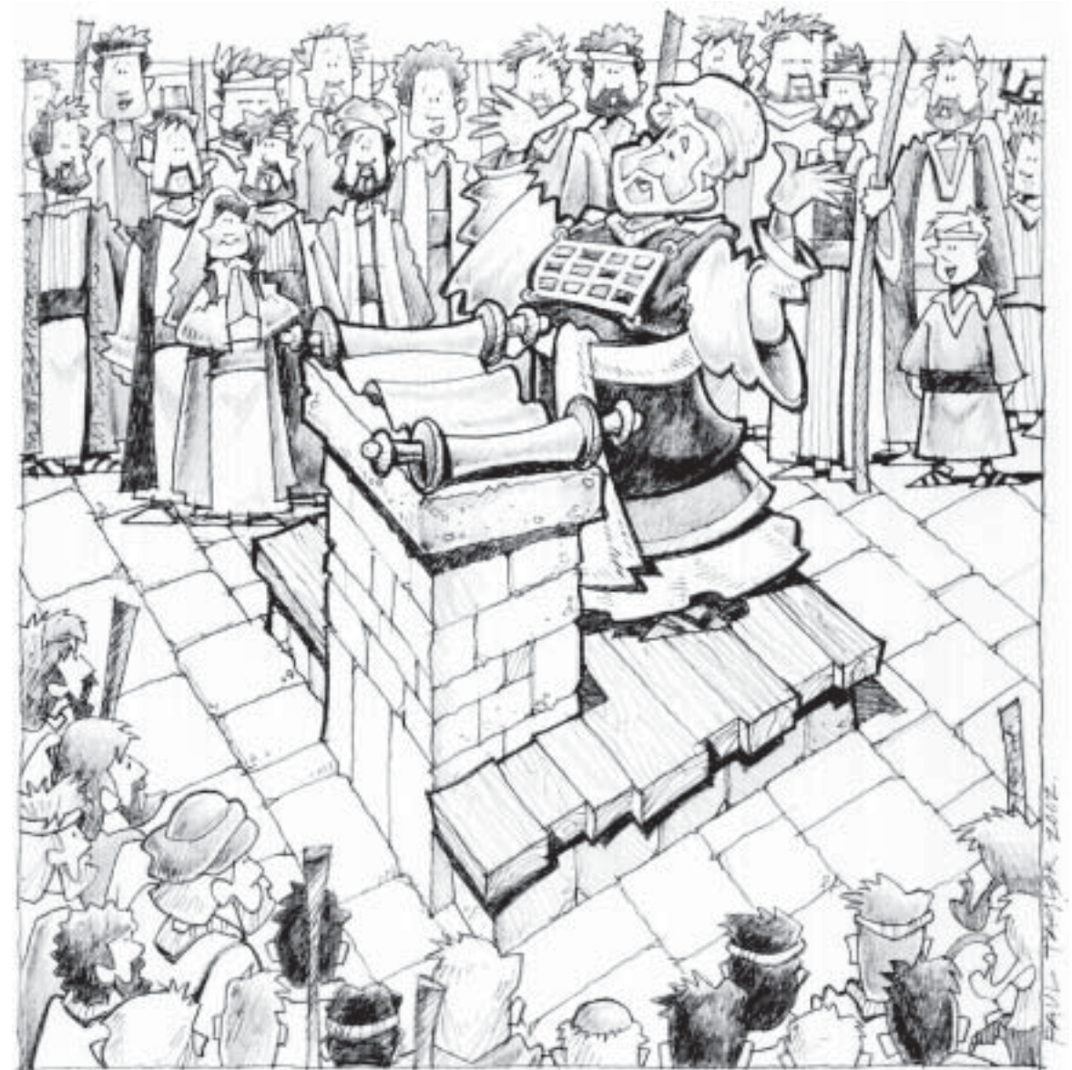
Esdras, grand-prêtre et éducateur national, lit la Parole de Dieu jour et nuit sur la place du marché à Jérusalem, afin que tous entendent.